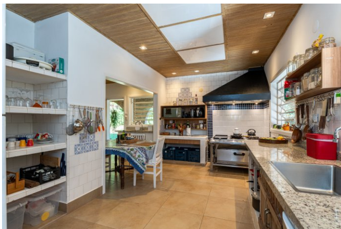
Cozinha ampla e completa para os amantes da culinária.

A casa possui ainda 4 ótimos quartos com 4x3 m, todos com piso em tábua corrida (para maior conforto) servidos por 2 banheiros com louças e metais de primeira qualidade, bancada em mármore e 2 aquecedores centrais elétricos de água.