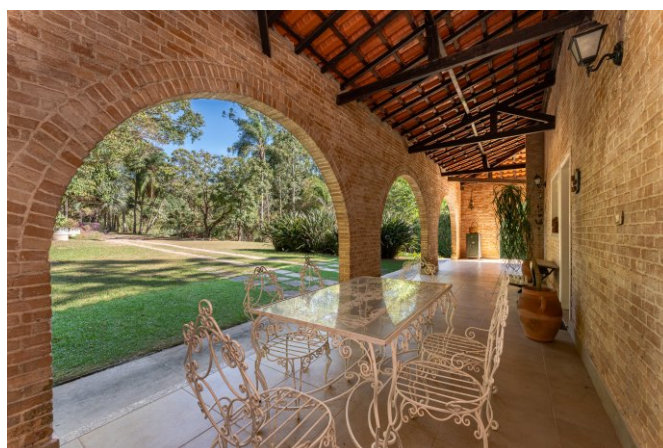
Varanda aberta, na entrada da casa.