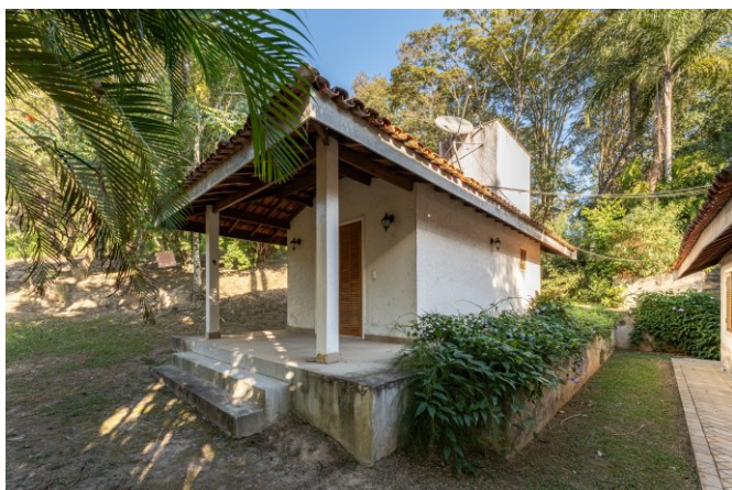
Chalé 2 com 2 quartos e 1 banheiro.