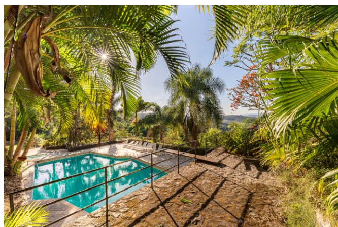
Piscina e deck para tomar sol.