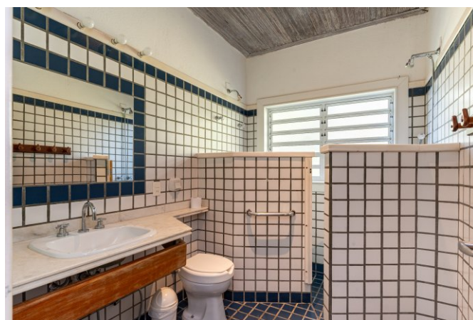
2 banheiros com louças e metais de primeira qualidade.