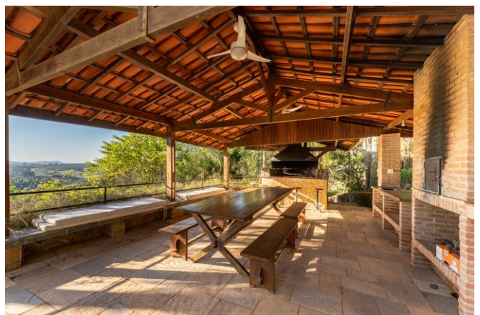
Área para churrasco e forno para pizza com vista.