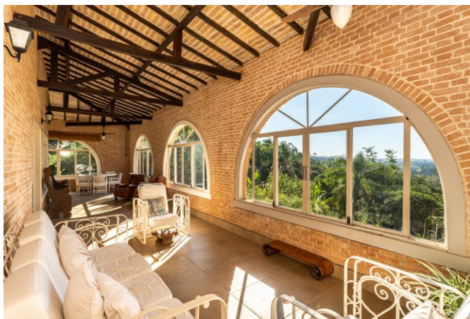
Varanda fechada com vista espetacular possibilita vários ambientes.

A ampla sala é dividida ao meio pela coluna da chaminé que serve 2 lareiras, uma para a sala de estar, outra para a sala de jantar. Além das salas, as varandas oferecem a possibilidade de vários outros ambientes de estar, sempre com vistas belíssimas para fora.