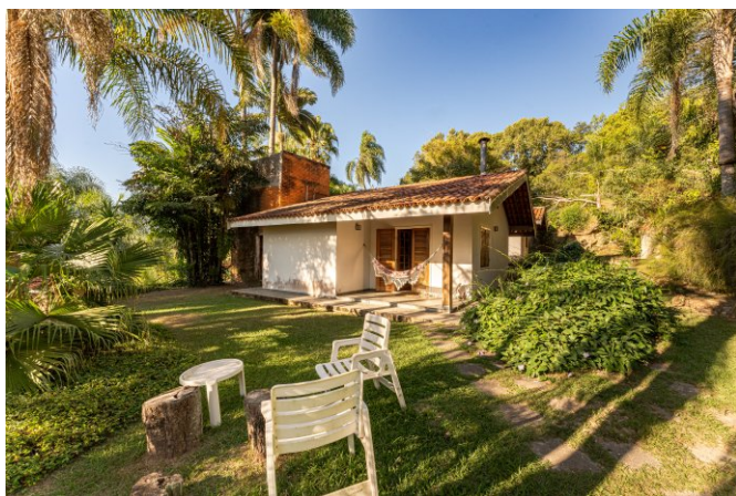
Chalé 1 com sala, 3 quartos e 2 banheiros (2 suítes).