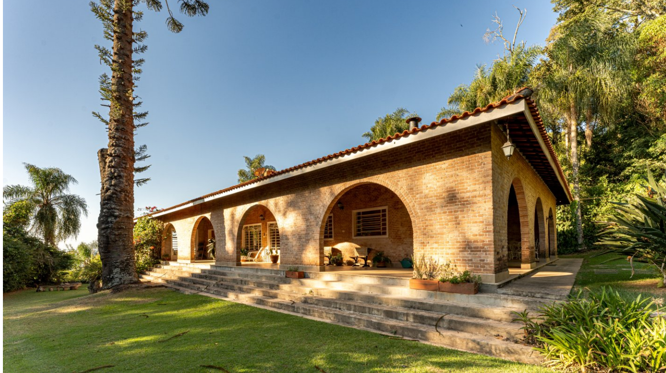
Jardim gramado dá amplidão à casa.

Para quem gosta de cozinhar, a casa é um prato cheio: a cozinha é ampla e bem iluminada. Conta com grande pia e bancadas de apoio além de excelente fogão industrial de 6 bocas e coifa de exaustão. A copa integrada aumenta a sensação de amplidão.