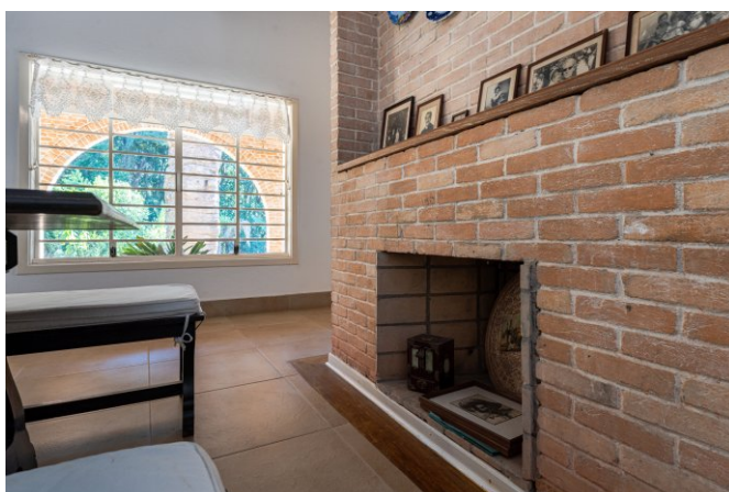
Lareira da sala de jantar.