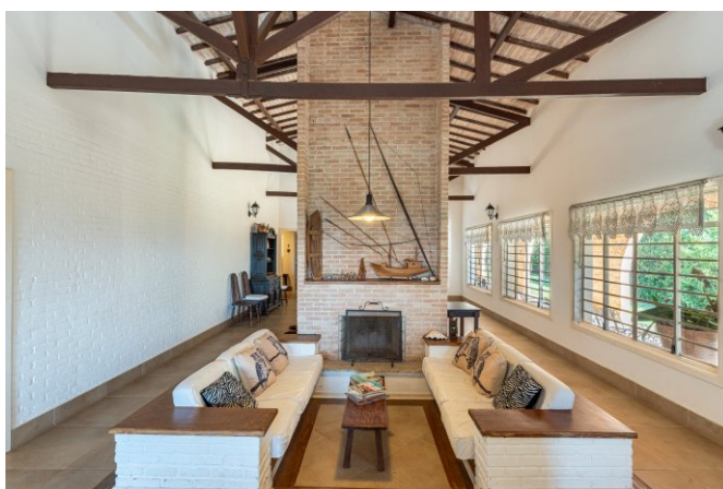
Coluna da chaminé das lareiras divide a sala e alimenta 2 lareiras.