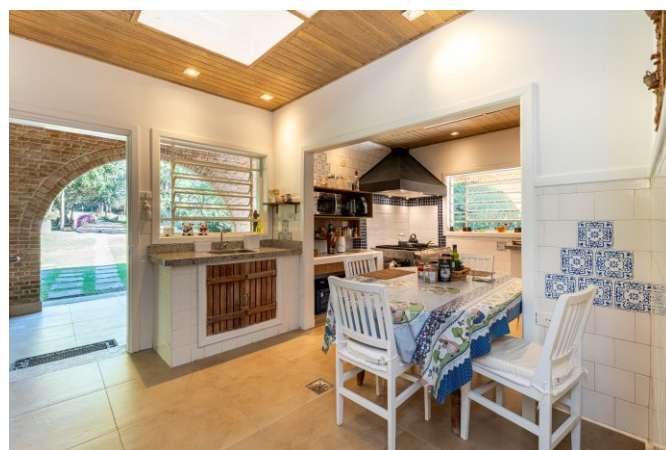
Cozinha tem ainda o apoio de copa.