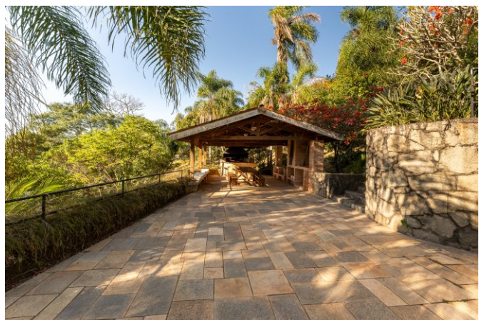
Área para churrasco e forno para pizza integrada às piscinas.