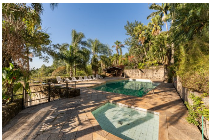
Piscina para crianças, também.