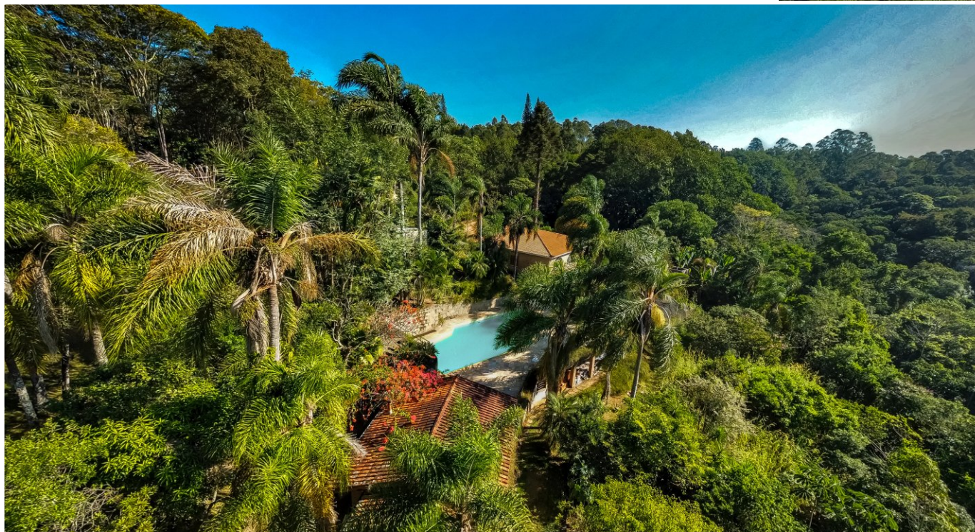
Implantação em local com natureza exuberante.