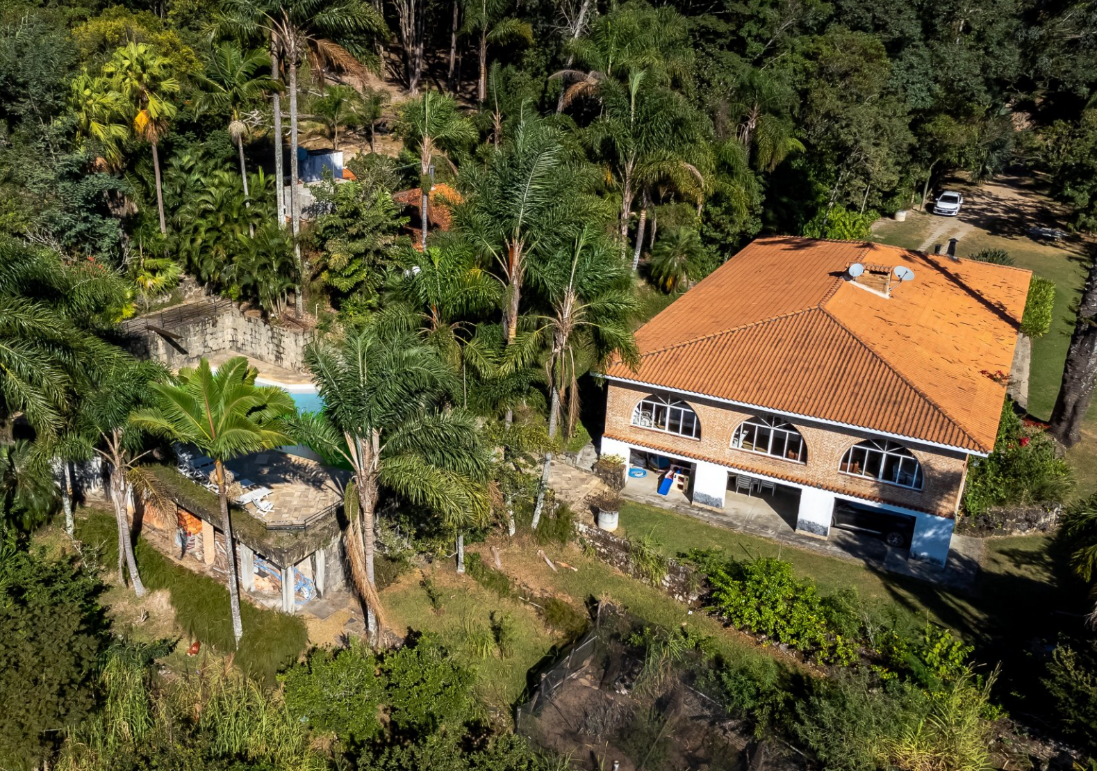
Sede do sítio conta com uma série de benfeitorias.