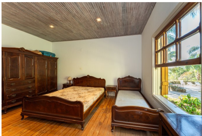
4 quartos com piso de madeira corrida.