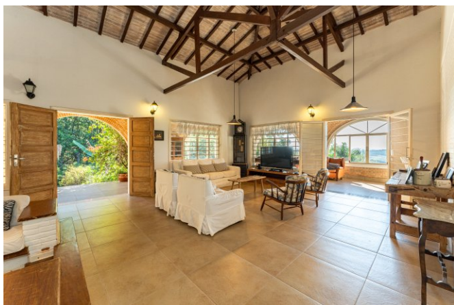
Sala de estar pode ser dividida em vários ambientes.